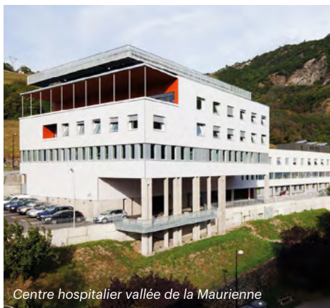
Centre hospitalier vallée de la Maurienne

Les sportifs amateurs ou professionnels peuvent évaluer leur condition physique et bénéficier d'un suivi médical au cours de leur entraînement grâce au Centre Médico-Sportif, mis en place en partenariat avec la Ville de Saint-Jean-de-Maurienne.